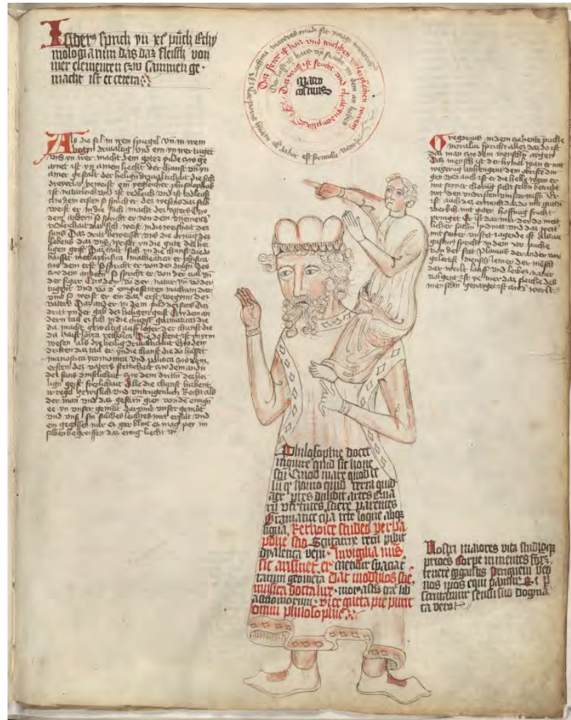
Darstellung (Süddeutschland, ca. 1410)